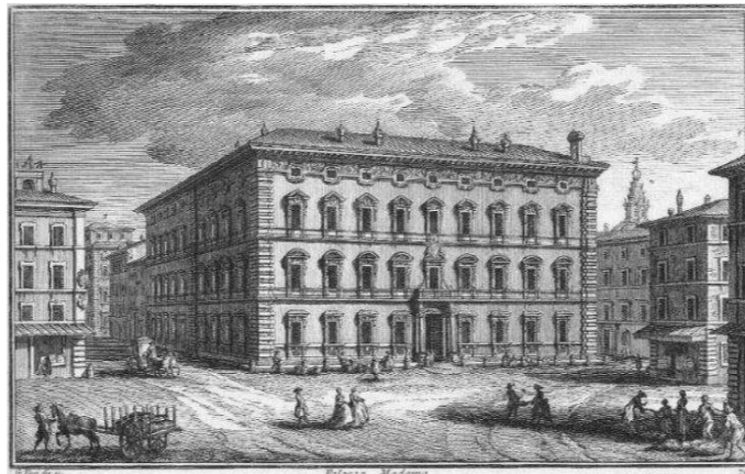
Palazzo Madama in una stampa dell' '800

1. La lettera e) dell'articolo 2 della legge 7 luglio 1901, n. 306 come sostituita dal comma 23 dell'articolo 52 della legge 27 dicembre 2002, n. 289, è sostituita dalla seguente: « e) il con-